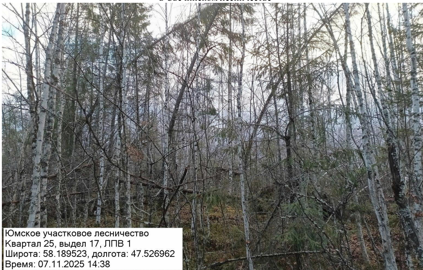
Юмское участковое лесничество Квартал 25, выдел 17, ЛПВ 1 Широта: 58.189523, долгота: 47.526962 Время: 07.11.2025 14:38

участка леса с назначенными санитарно-оздоровительными мероприятиями в Свечинском лесничестве