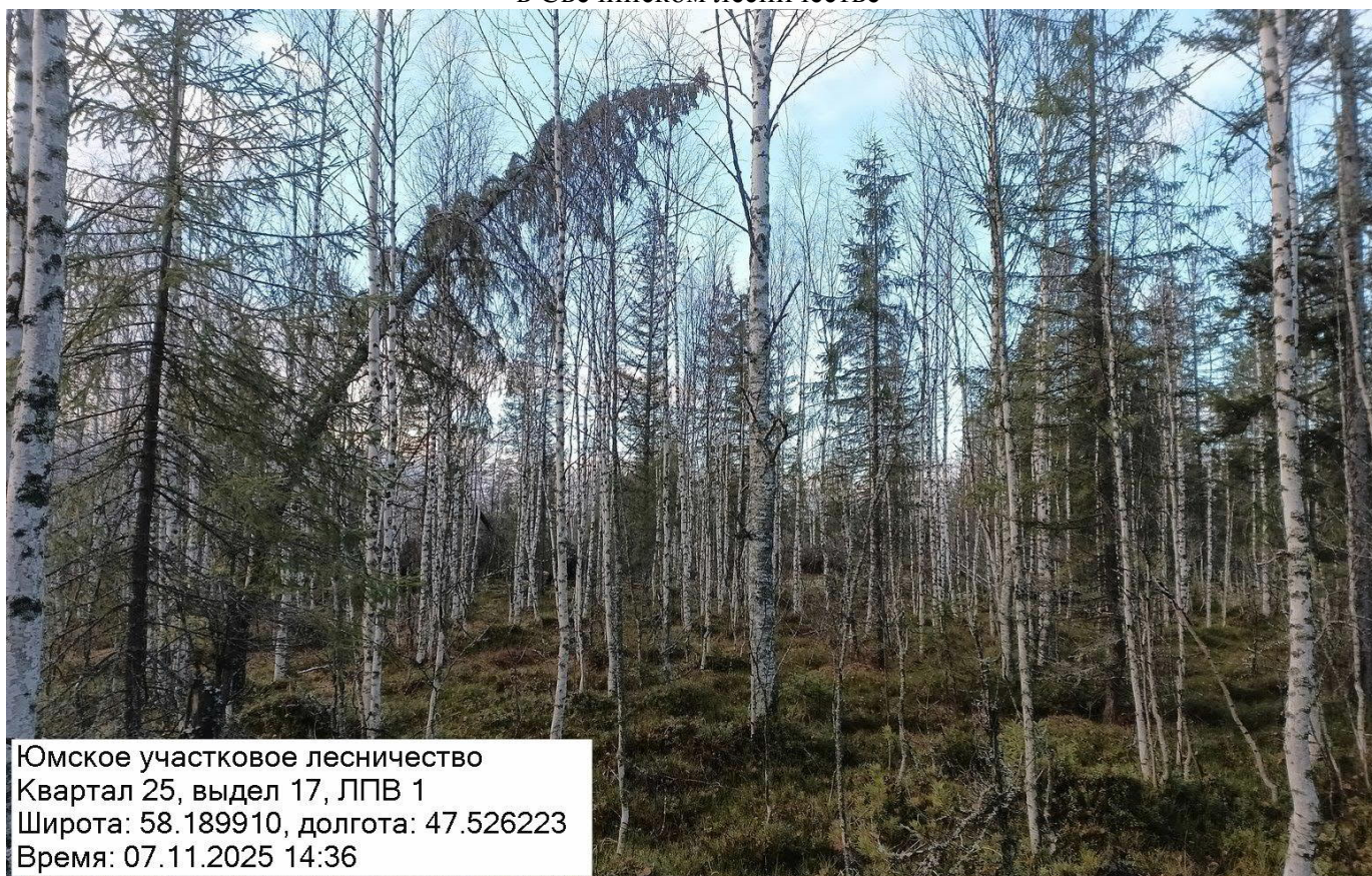
Юмское участковое лесничество Квартал 25, выдел 17, ЛПВ 1 Широта: 58.189910, долгота: 47.526223 Время: 07.11.2025 14:36