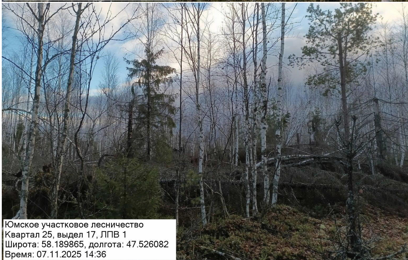
Юмское участковое лесничество Квартал 25, выдел 17, ЛПВ 1 Широта: 58.189865, долгота: 47.526082 Время: 07.11.2025 14:36

Исполнитель работ по проведению лесопатологического обследования: