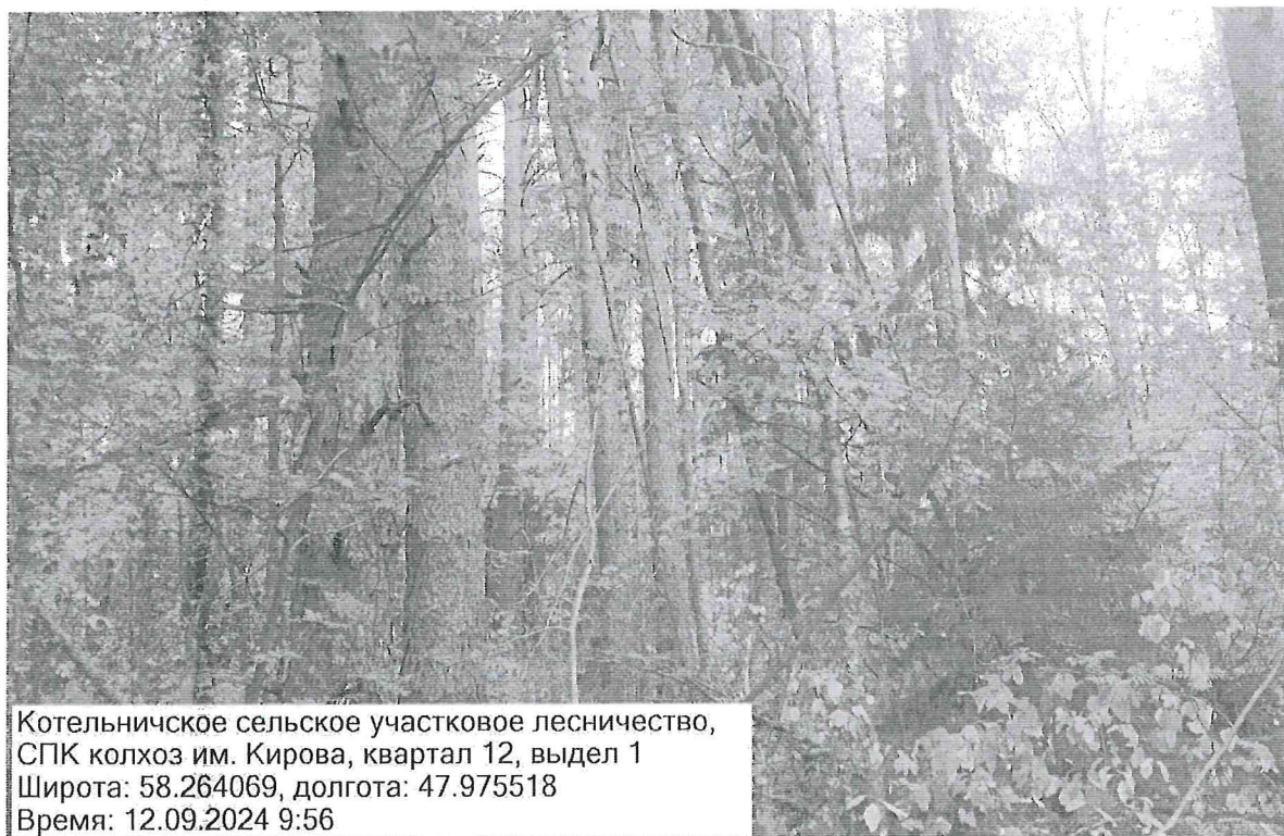
Котельничское сельское участковое лесничество, СПК колхоз им. Кирова, квартал 12, выдел 1 Широта: 58.264069, долгота: 47.975518 Время: 12.09.2024 9:56

участка леса без назначения санитарно-оздоровительных мероприятий в Котельничском лесничестве