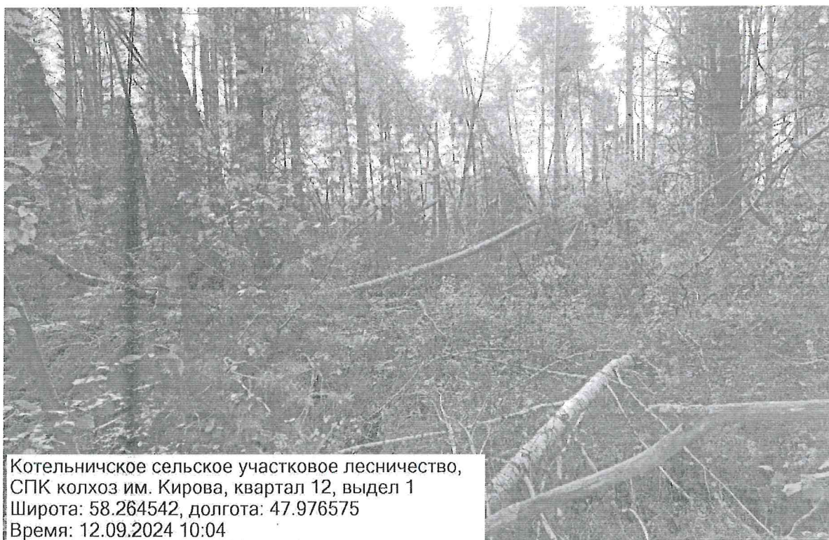
Котельничское сельское участковое лесничество, СПК колхоз им. Кирова, квартал 12, выдел 1 Широта: 58.264542, долгота: 47.976575 Время: 12.09.2024 10:04

Исполнитель работ по проведению лесопатологического обследования: