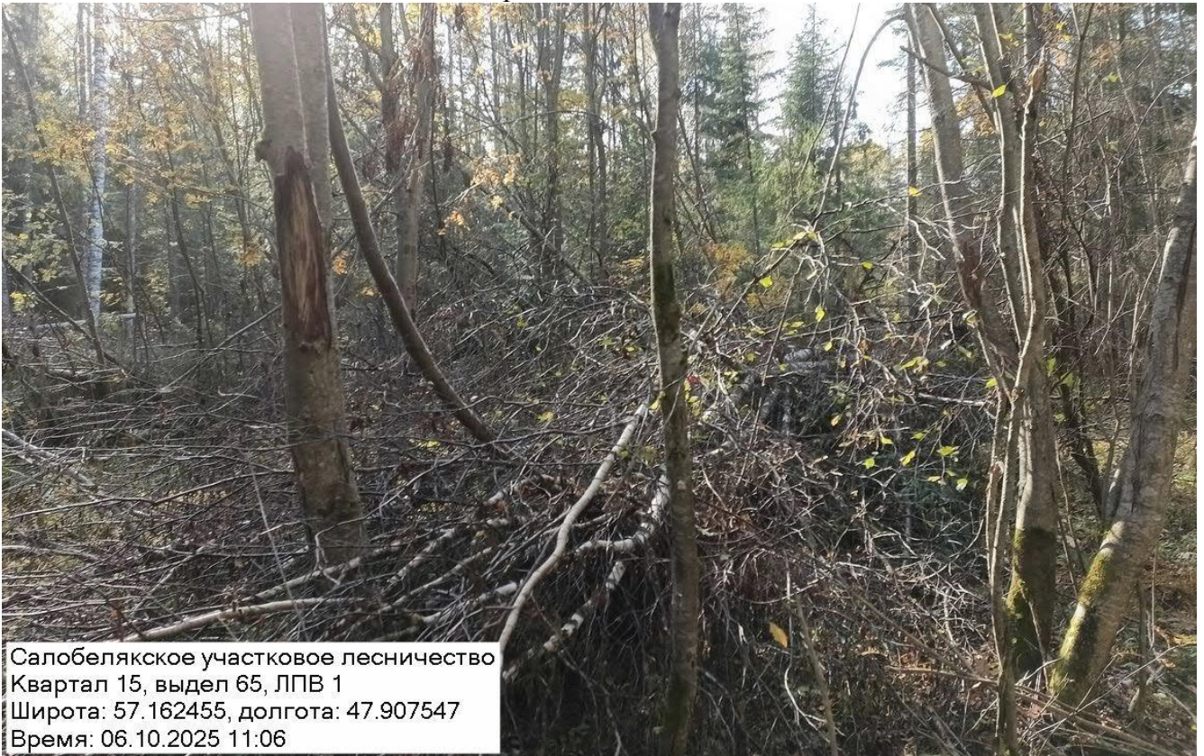
Салобелякское участковое лесничество Квартал 15, выдел 65, ЛПВ 1 Широта: 57.162455, долгота: 47.907547 Время: 06.10.2025 11:06