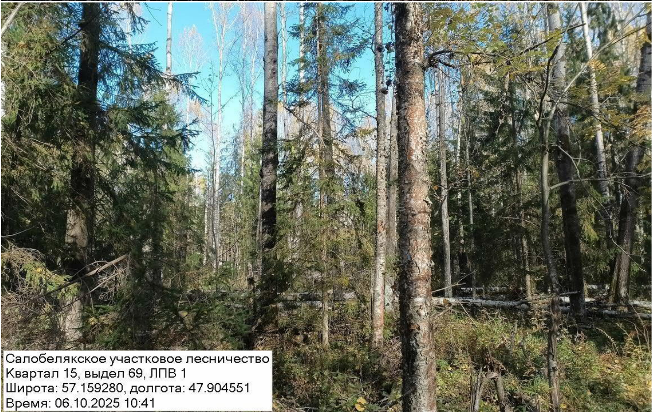
Салобелякское участковое лесничество Квартал 15, выдел 69, ЛПВ 1 Широта: 57.159280, долгота: 47.904551 Время: 06.10.2025 10:41

Исполнитель работ по проведению лесопатологического обследования: