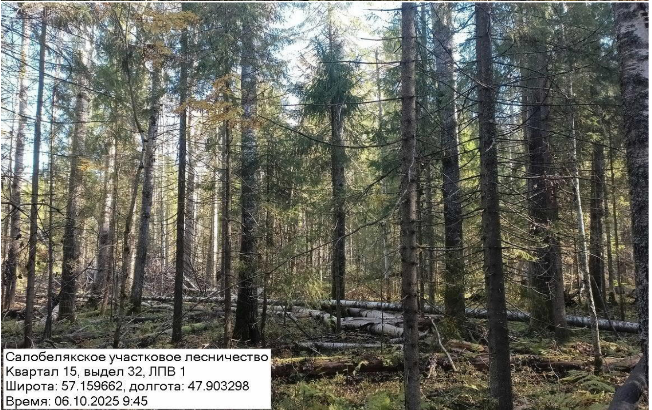
Салобелякское участковое лесничество Квартал 15, выдел 32, ЛПВ 1 Широта: 57.159662, долгота: 47.903298 Время: 06.10.2025 9:45

Исполнитель работ по проведению лесопатологического обследования: