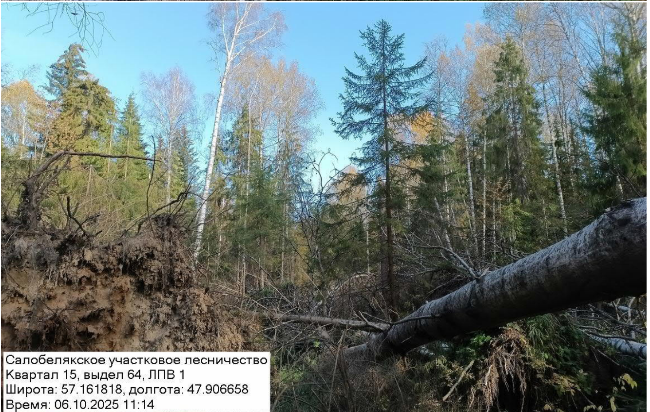
Салобелякское участковое лесничество Квартал 15, выдел 64, ЛПВ 1 Широта: 57.161818, долгота: 47.906658 Время: 06.10.2025 11:14

Исполнитель работ по проведению лесопатологического обследования: