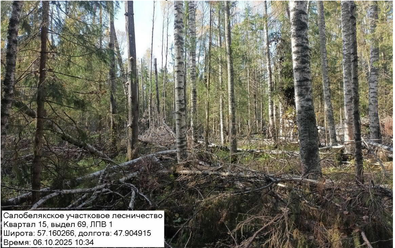
Салобелякское участковое лесничество Квартал 15, выдел 69, ЛПВ 1 Широта: 57.160266, долгота: 47.904915 Время: 06.10.2025 10:34