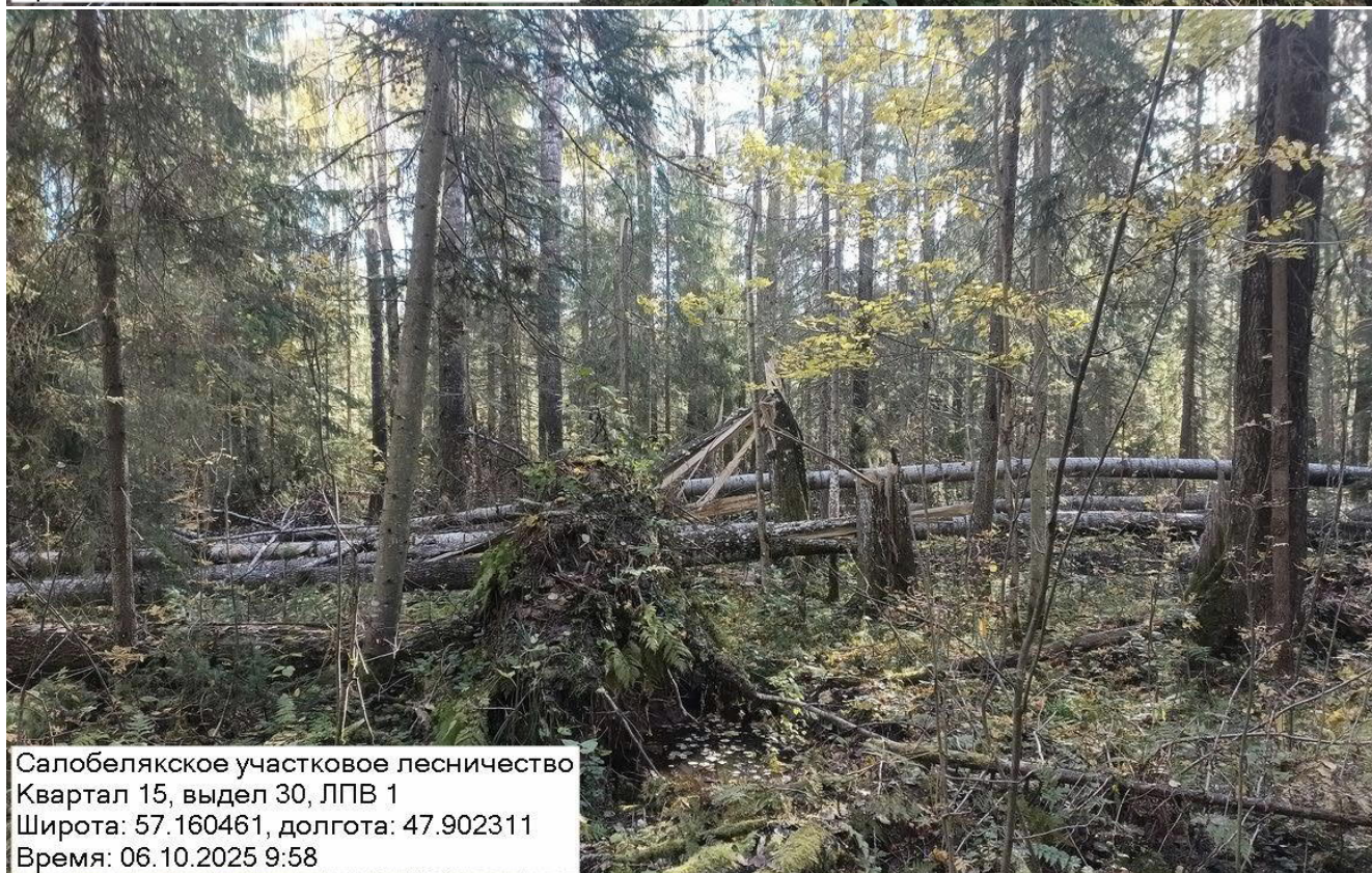
Салобеляжское участковое лесничество Квартал 15, выдел 30, ЛПВ 1 Широта: 57.160461, долгота: 47.902311 Время: 06.10.2025 9:58

Исполнитель работ по проведению лесопатологического обследования: