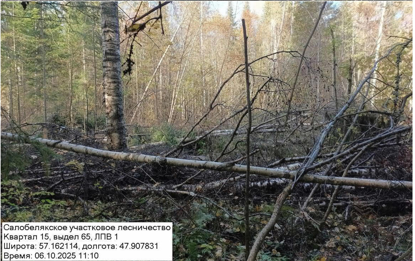
Салобелякское участковое лесничество Квартал 15, выдел 65, ЛПВ 1 Широта: 57.162114, долгота: 47.907831 Время: 06.10.2025 11:10

Исполнитель работ по проведению лесопатологического обследования: