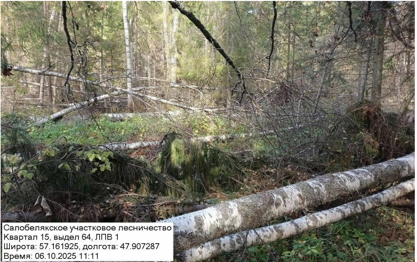
Салобелякское участковое лесничество Квартал 15, выдел 64, ЛПВ 1 Широта: 57.161925, долгота: 47.907287 Время: 06.10.2025 11:11