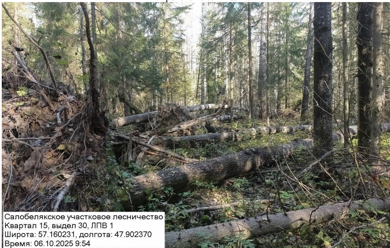
Салобеляжское участковое лесничество Квартал 15, выдел 30, ЛПВ 1 Широта: 57.160231, долгота: 47.902370 Время: 06.10.2025 9:54