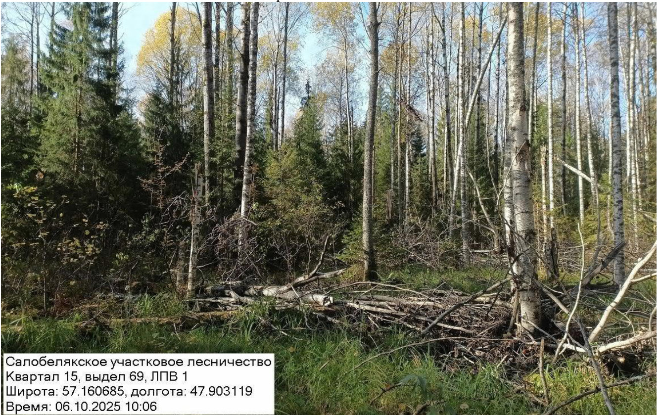
Салобеляжское участковое лесничество Квартал 15, выдел 69, ЛПВ 1 Широта: 57.160685, долгота: 47.903119 Время: 06.10.2025 10:06