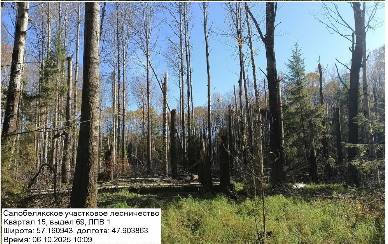
Салобеляжское участковое лесничество Квартал 15, выдел 69, ЛПВ 1 Широта: 57.160943, долгота: 47.903863 Время: 06.10.2025 10:09

Исполнитель работ по проведению лесопатологического обследования: