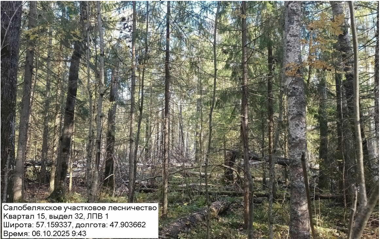
Салобелякское участковое лесничество Квартал 15, выдел 32, ЛПВ 1 Широта: 57.159337, долгота: 47.903662 Время: 06.10.2025 9:43