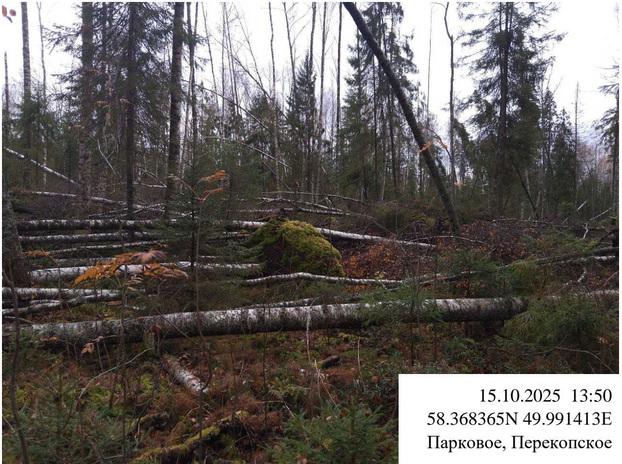
15.10.2025 13:50 58.368365N 49.991413E Парковое, Перекопское