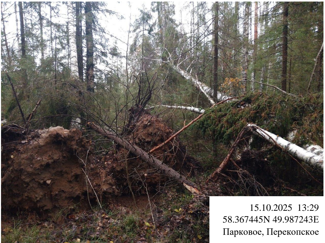
15.10.2025 13:29 58.367445N 49.987243E Парковое, Перекопское