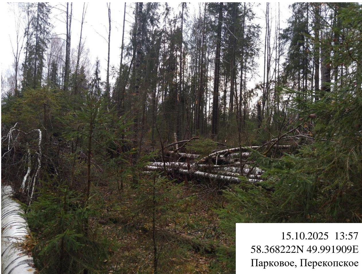
15.10.2025 13:57 58.368222N 49.991909E Парковое, Перекопское