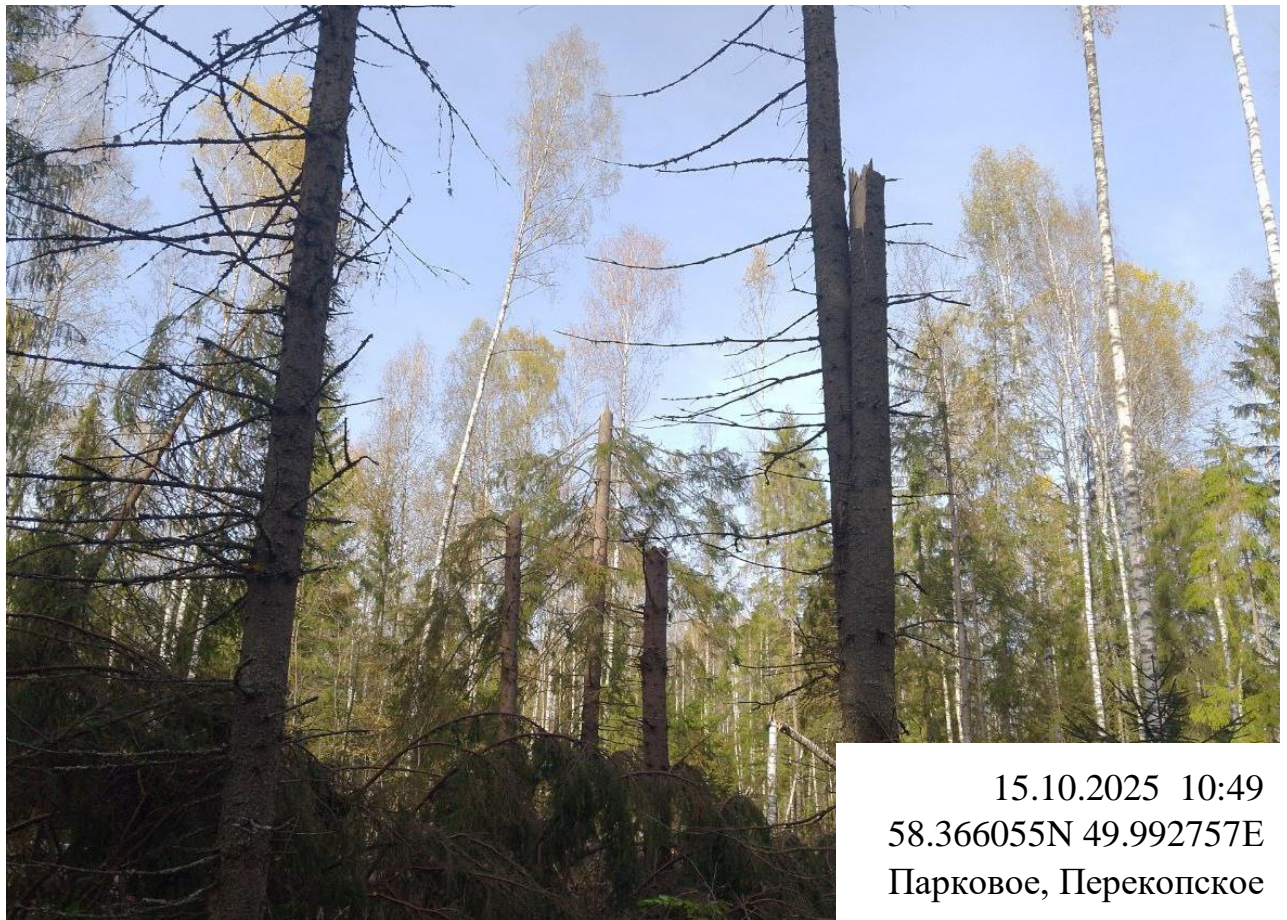
15.10.2025 10:49 58.366055N 49.992757E Парковое, Перекопское