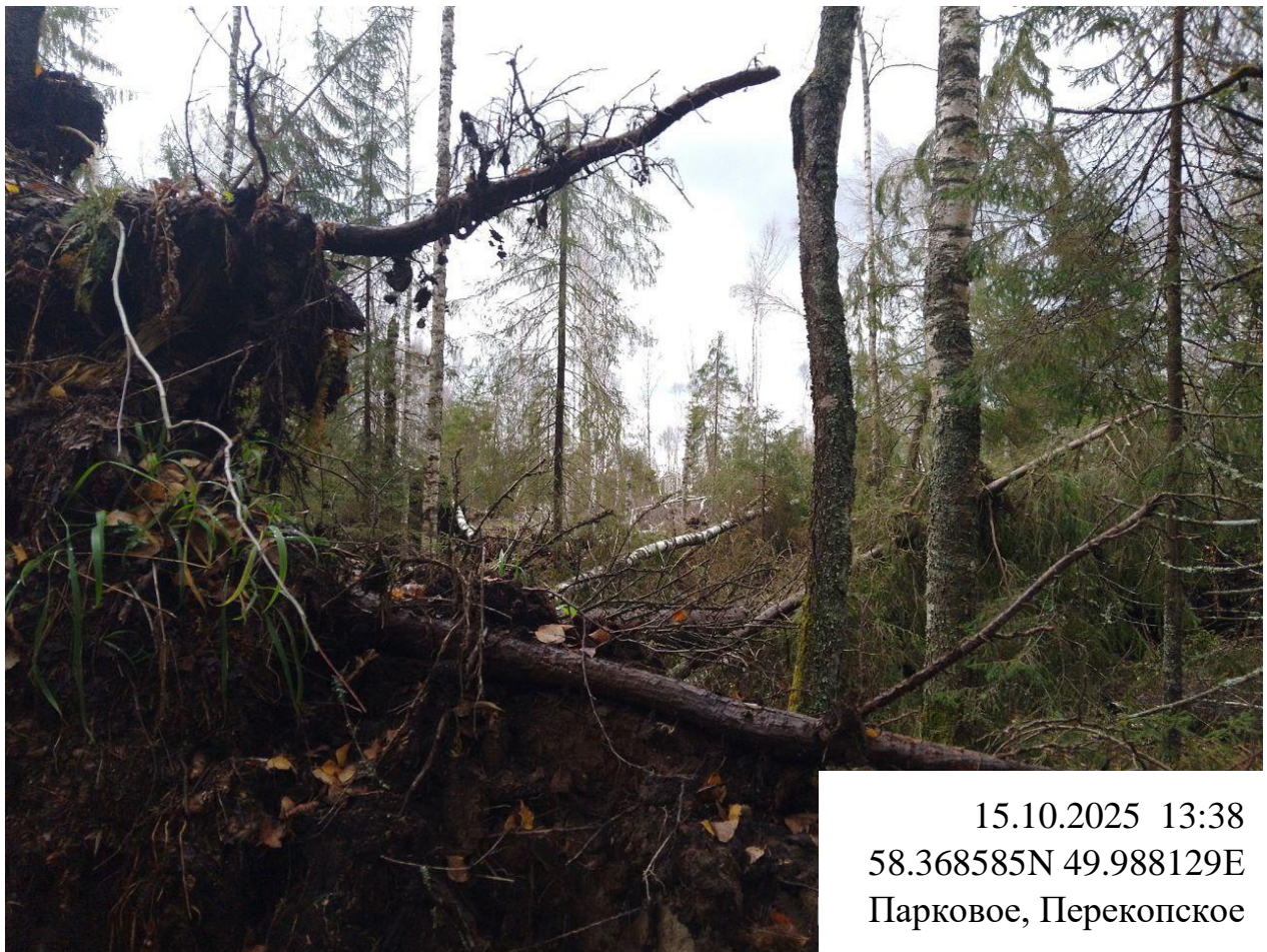
15.10.2025 13:38 58.368585N 49.988129E Парковое, Перекопское