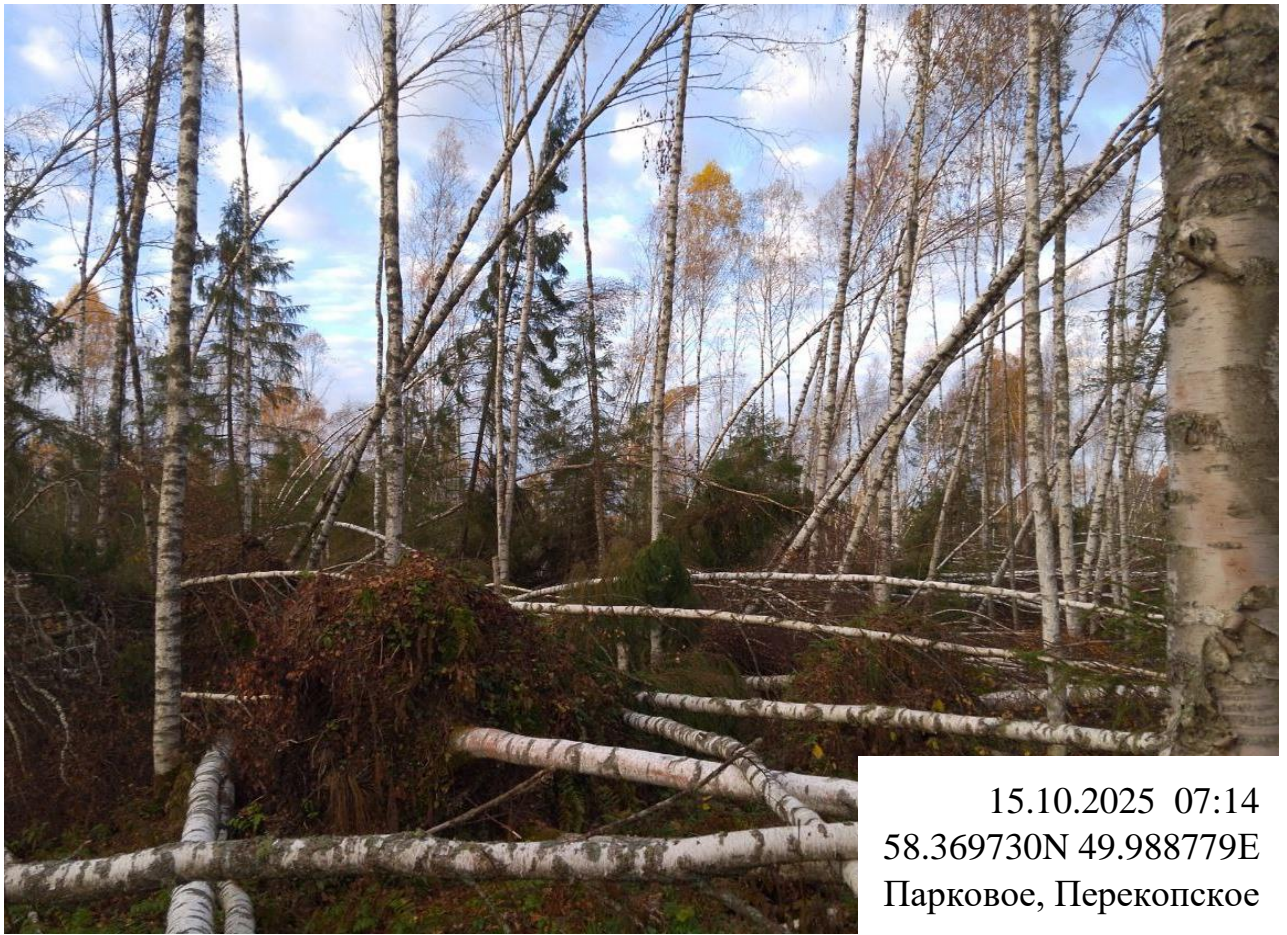
15.10.2025 07:14 58.369730N 49.988779E Парковое, Перекопское