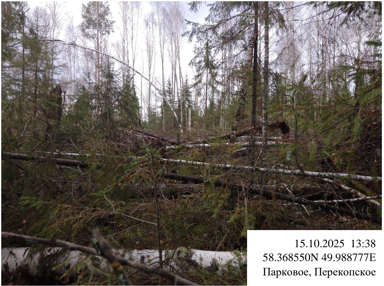
15.10.2025 13:38 58.368550N 49.988777E Парковое, Перекопское