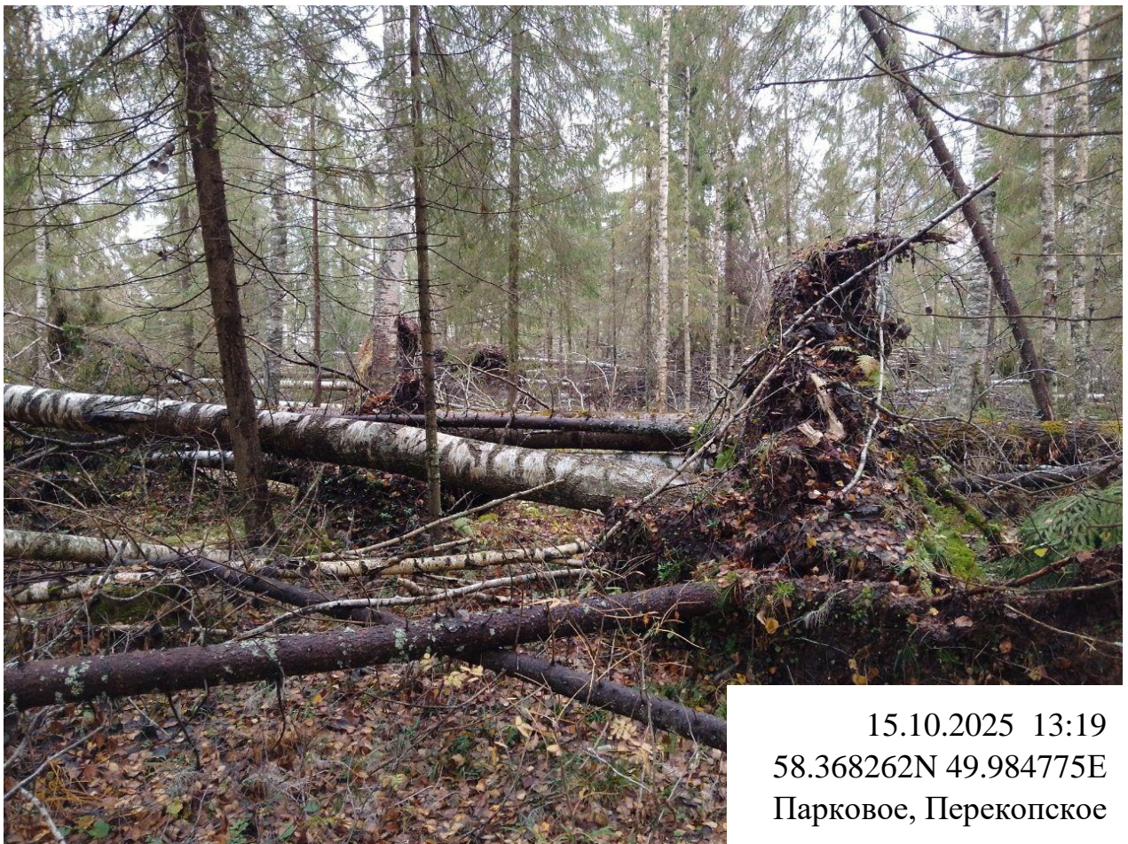
15.10.2025 13:19 58.368262N 49.984775E Парковое, Перекопское