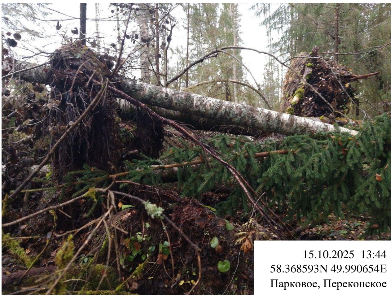
15.10.2025 13:44 58.368593N 49.990654E Парковое, Перекопское