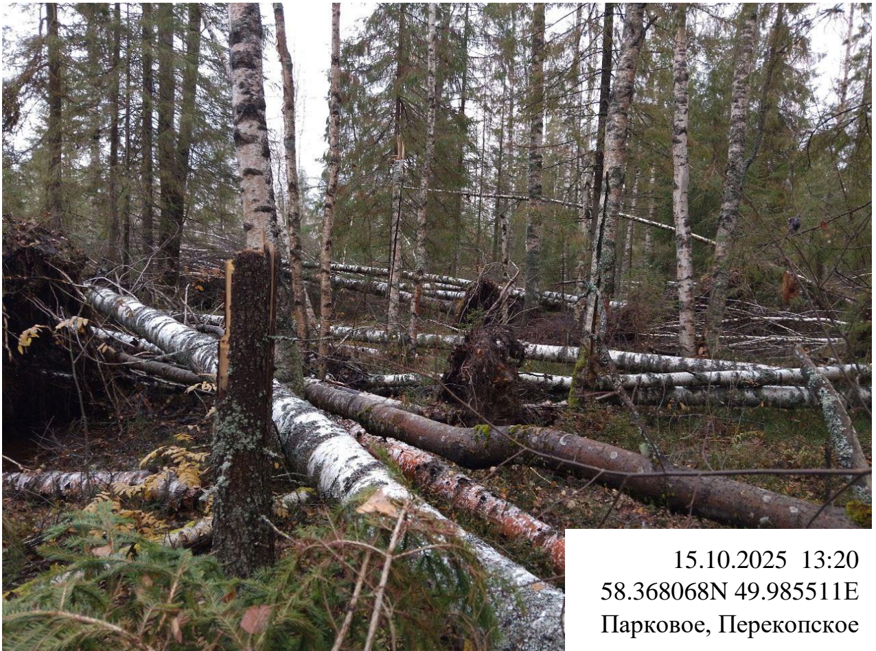
15.10.2025 13:20 58.368068N 49.985511E Парковое, Перекопское